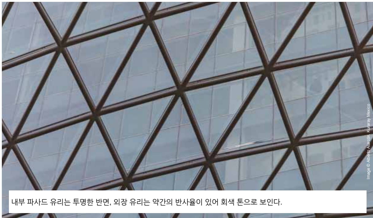
내부 파사드 유리는 투명한 반면, 외장 유리는 약간의 반사율이 있어 회색 톤으로 보인다.

"에너지 성능과 보안 요건도 고려해야 했습니다. 외장 파사드에 고성능 유리를 사용하여 냉방 시스템의 에너지 부하를 줄였습니다. 내부는 유리 난간에 충격이 가해지거나 공중에 매달려 있는 스크린에 지진이 영향을 미칠 경우를 대비해 방문객 안전을 보장할 수 있는 신뢰도 높은 솔루션 설계에 집중했습니다. 이러한 요구에 따라 Trosifol® 중간막이 전체적인 비전에서 본질적인 요소가 되었습니다."