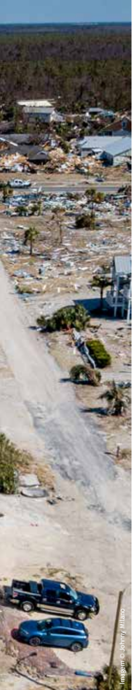
Imagem