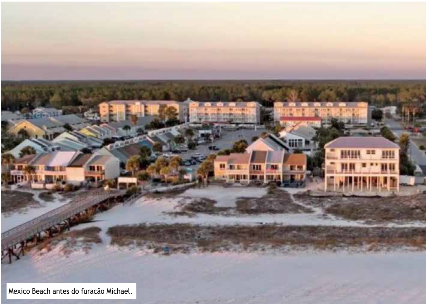
Mexico Beach antes do furacão Michael.

“Mexico Beach é uma comunidade eclética de casas construídas durante vários períodos e de acordo com vários códigos de construção utilizados nos últimos 60 anos”, contou ele. “E desde então pagou um preço muito alto pelos dados que agora estão disponíveis sobre a capacidade de sobrevivência de estruturas afetadas pelo estresse de um furacão de categoria 5, resultados esses que são relevantes tanto para estruturas existentes quanto para as novas.”