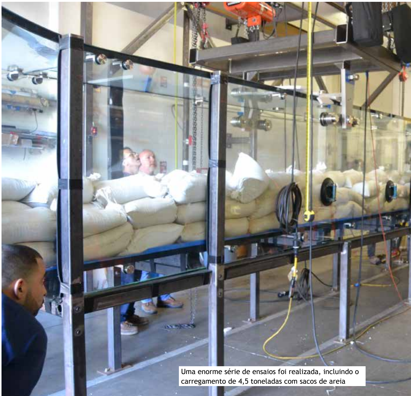
Uma enorme série de ensaios foi realizada, incluindo o carregamento de 4,5 toneladas com sacos de areia

SentryGlas® também foi especificado por sua clareza e estabilidade de borda. “O apelo do escorregador é que ele possibilita vistas livres e contínuas”, elabora Ludvik, “graças ao design dos suportes e à forma que os painéis de vidro são fabricados e montados com bordas expostas. Isto significa que, aliada à clareza do SentryGlas®, a estabilidade de borda foi um aspecto importante. Nós simplesmente não poderíamos ter a estética do escorregador comprometida após um curto espaço de tempo, o que implicaria na fechamento para manutenção do mesmo, então nós buscamos o melhor conjunto possível de propriedades em materiais para laminação de vidro.