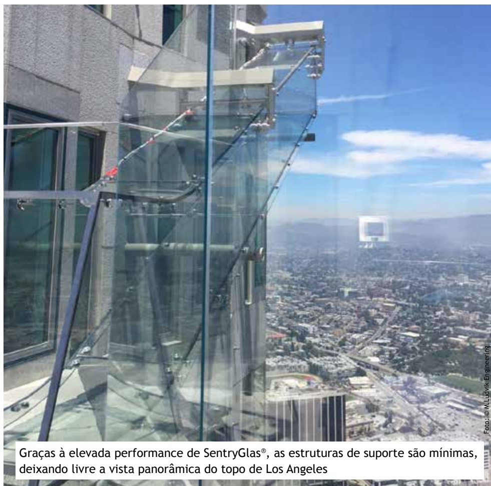
Graças à elevada performance de SentryGlas®, as estruturas de suporte são mínimas, deixando livre a vista panorâmica do topo de Los Angeles

O vidro usado na sua construção foi um elemento vital para a performance funcional e estética. “Nós sabíamos que não somente tínhamos que oferecer resistência, mas também clareza, então decidimos usar SentryGlas® da Trosifol®. Esta decisão foi tomada principalmente pela sua ação estrutural integrada, que proporciona rigidez em altas temperaturas e excepcional estabilidade pós-quebra – no caso de quebra dos vidros, o SentryGlas® ainda é capaz de suportar cargas significativas.”