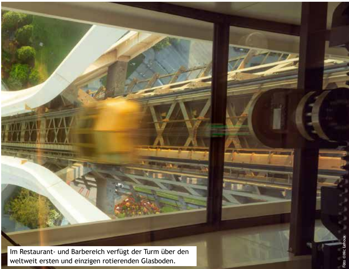
Im Restaurant- und Barbereich verfügt der Turm über den weltweit ersten und einzigen rotierenden Glasboden.

Und Green abschließend: „Die nächste große Aufgabe ist die Erarbeitung einer Norm, die es Architekten und Planern grundsätzlich ermöglicht, Glas als ein Bauteil mit der Möglichkeit duktilen Versagens einzusetzen. Die Idee dahinter: Glaskonstruktionen behalten auch im Falle des Versagens eine sichere Resttragfähigkeit und garantieren damit die Sicherheit der Gesamtkonstruktion – nur auf der Basis konnten wir dieses Projekt realisieren. SentryGlas® ermöglichte den Einsatz großer Glasscheiben mit einfachen und schmalen Halterungen, weil damit hergestelltes VSG selbst dann noch funktioniert, wenn das Glas gebrochen ist. Ohne diese Resttragfähigkeit nach Bruch hätte das Glas umfangreichere Halterungen benötigt, die letztendlich den Ausblick eingeschränkt hätten.“