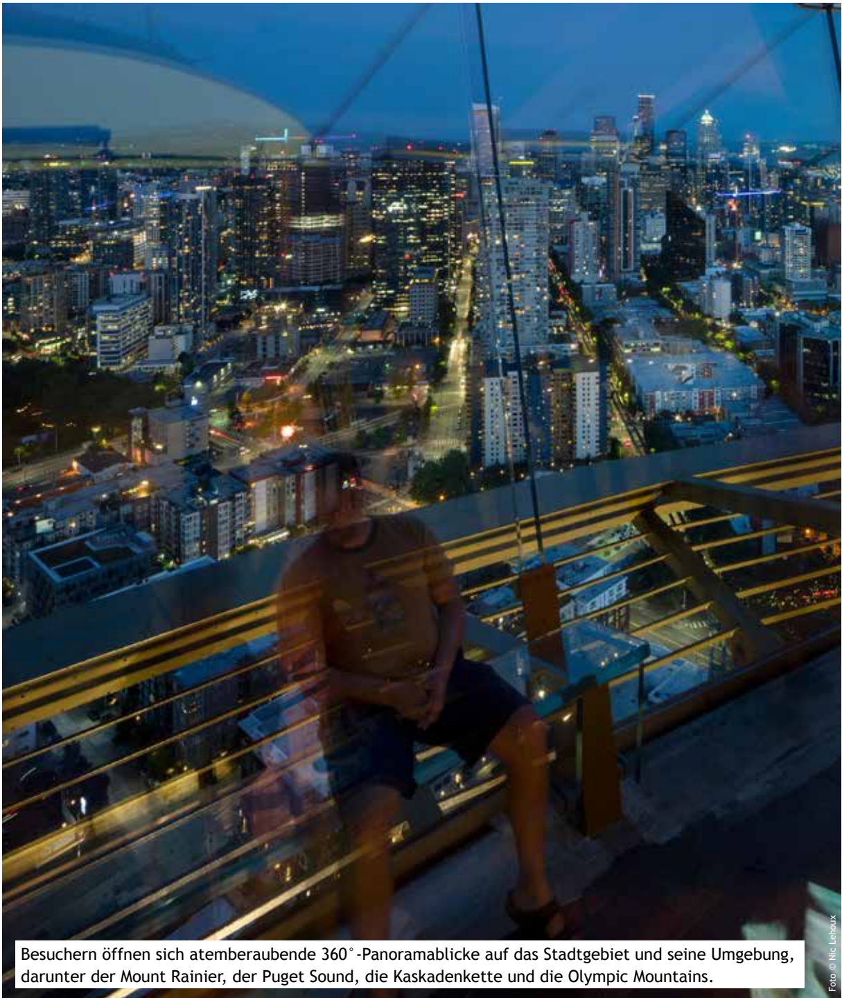
Besuchern öffnen sich atemberaubende 360°-Panoramablicke auf das Stadtgebiet und seine Umgebung, darunter der Mount Rainier, der Puget Sound, die Kaskadenkette und die Olympic Mountains.