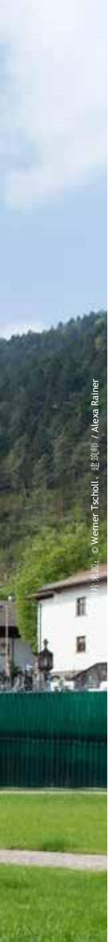
图片来源: © Werner Tscholl, 建筑师 / Alexa Rainer

通过将该公墓融入日常人流交通之中, 设计师改变了公墓的隔离封锁状态, 并将其整合为日常生活通道。如此, 该公墓融入到人们的现世生活中, 但同时并未失去其作为永恒性地点的意义。