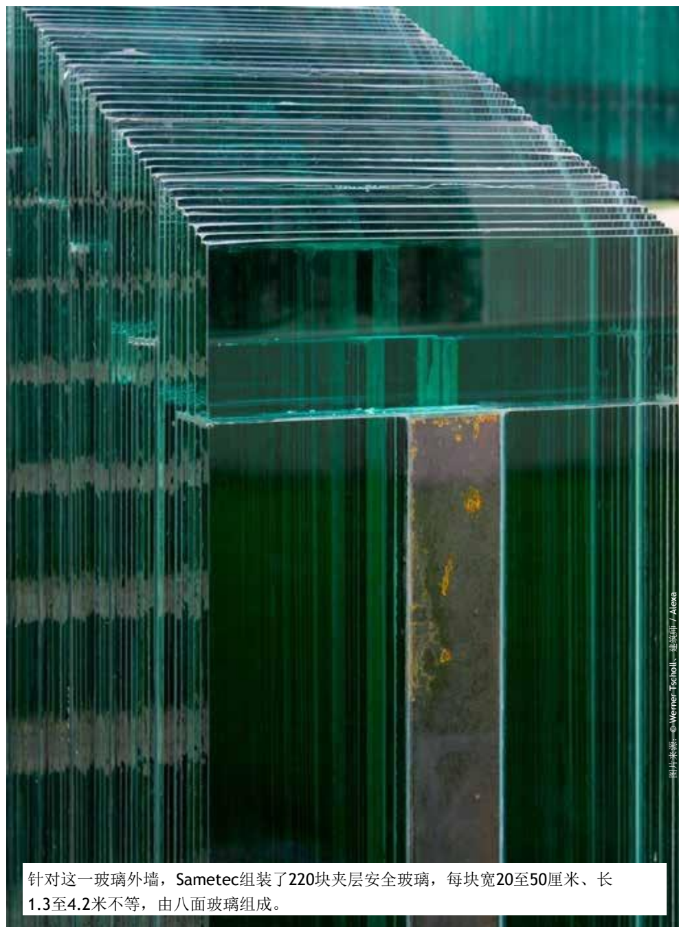
图片来源: © Werner Tscholl, 建筑师 / Alexa

该项目创造了一个全新的自治化公墓区域, 在外观上展现了兼具现代感和古典性的建筑特征。