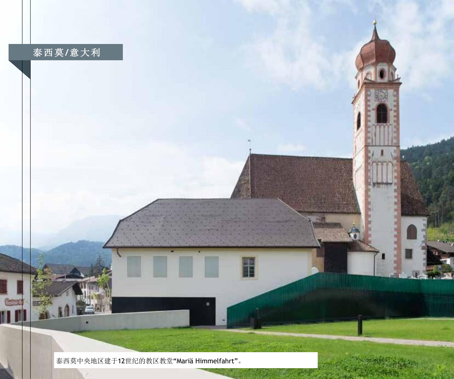
泰西莫中央地区建于12世纪的教区教堂“Mariä Himmelfahrt”。