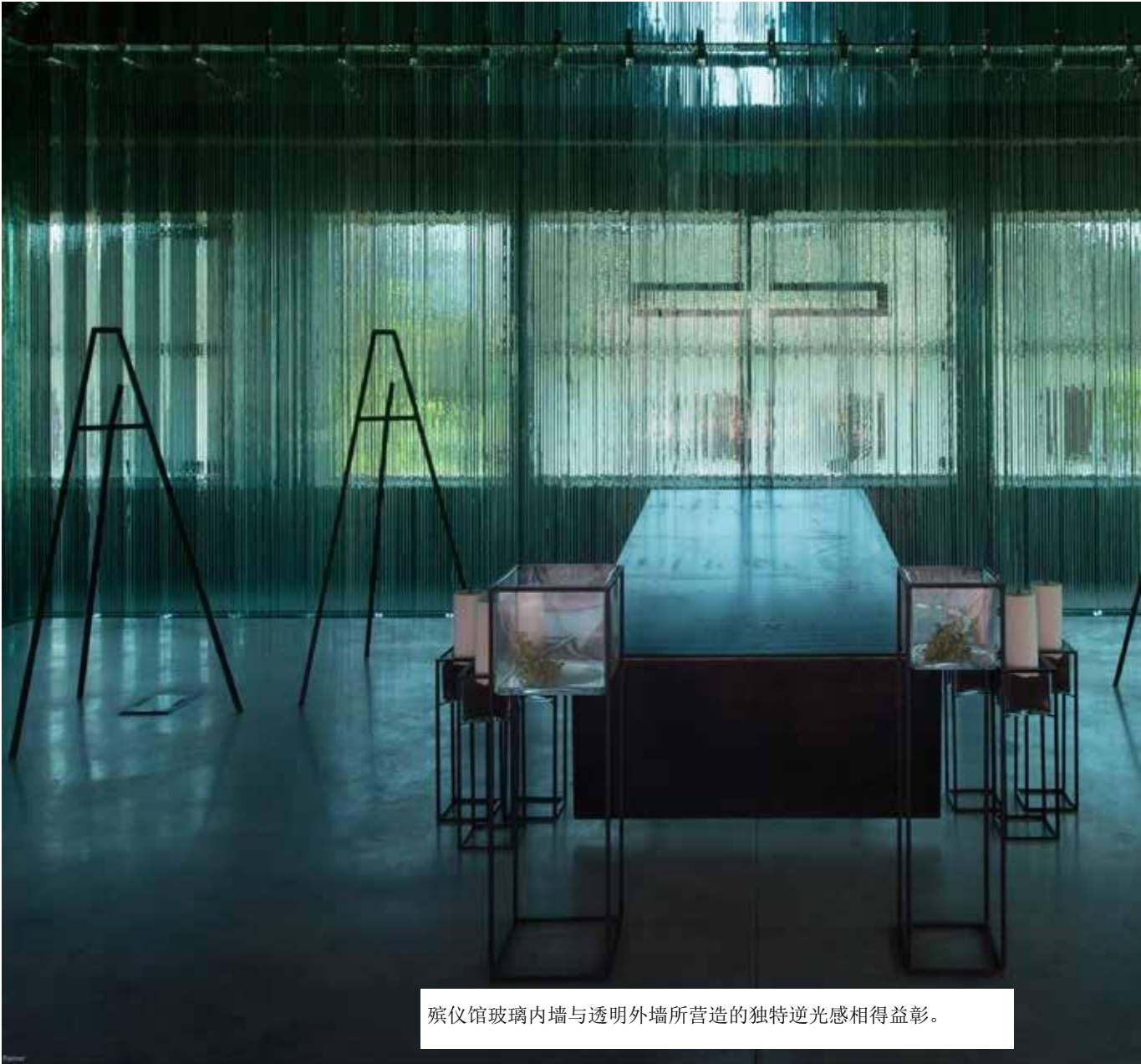
殡仪馆玻璃内墙与透明外墙所营造的独特逆光感相得益彰。

凭借具有永恒纪念意义的组件（尽管整体设计强调轻松明快），这一L形玻璃墙凭借其玻璃的微妙透明性呈现出独特的效果。这种透明感被融入殡仪馆，使这里的玻璃内墙与外墙所营造的独特逆光感相得益彰。另外，整面墙可通过LED灯光照明，以创造一种适合某些特定场合的“永恒之光”氛围。